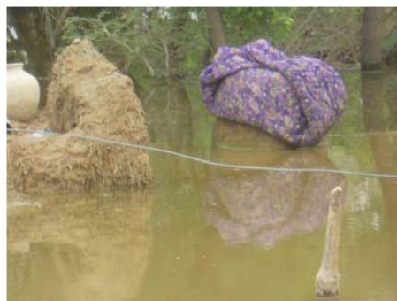
El Coordinador Nacional de C. Pakistán durante la evaluación de los daños y las necesidades y restos de una vivienda destruida bajo las aguas